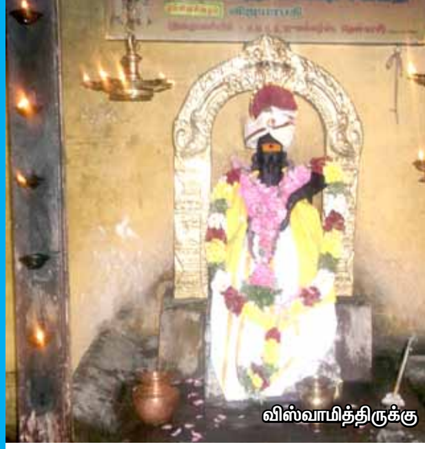
விஸ்வாமித்திரருக்கு நடைபெறும் பூஜை